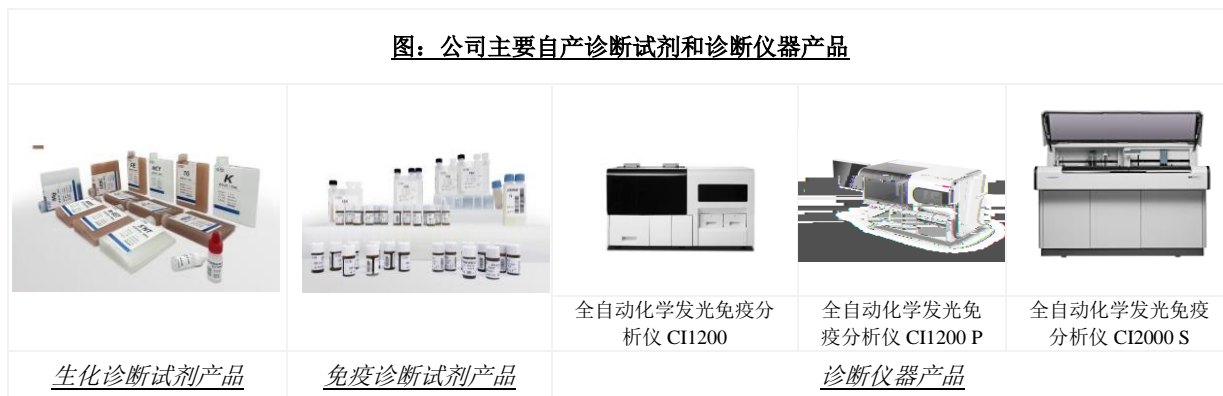
图：公司主要自产诊断试剂和诊断仪器产品

公司在生物化学原料领域产品包括生物酶、辅酶、抗原、抗体、精细化学品等各种试剂，应用范围涵盖生物科技、临床诊断和化工生产等多个方面。公司是国内极少数掌握诊断酶制备技术的诊断试剂生产企业之一。全资子公司阿匹斯通过借助利德曼多年积累的体外诊断行业渠道、国内各级医疗机构以及科研机构资源，可以服务于体外诊断、临床诊断与医疗、生命科学、食品检测等专业领域的企业、大学、科研院所。